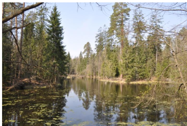
Puszcza Kozienicka